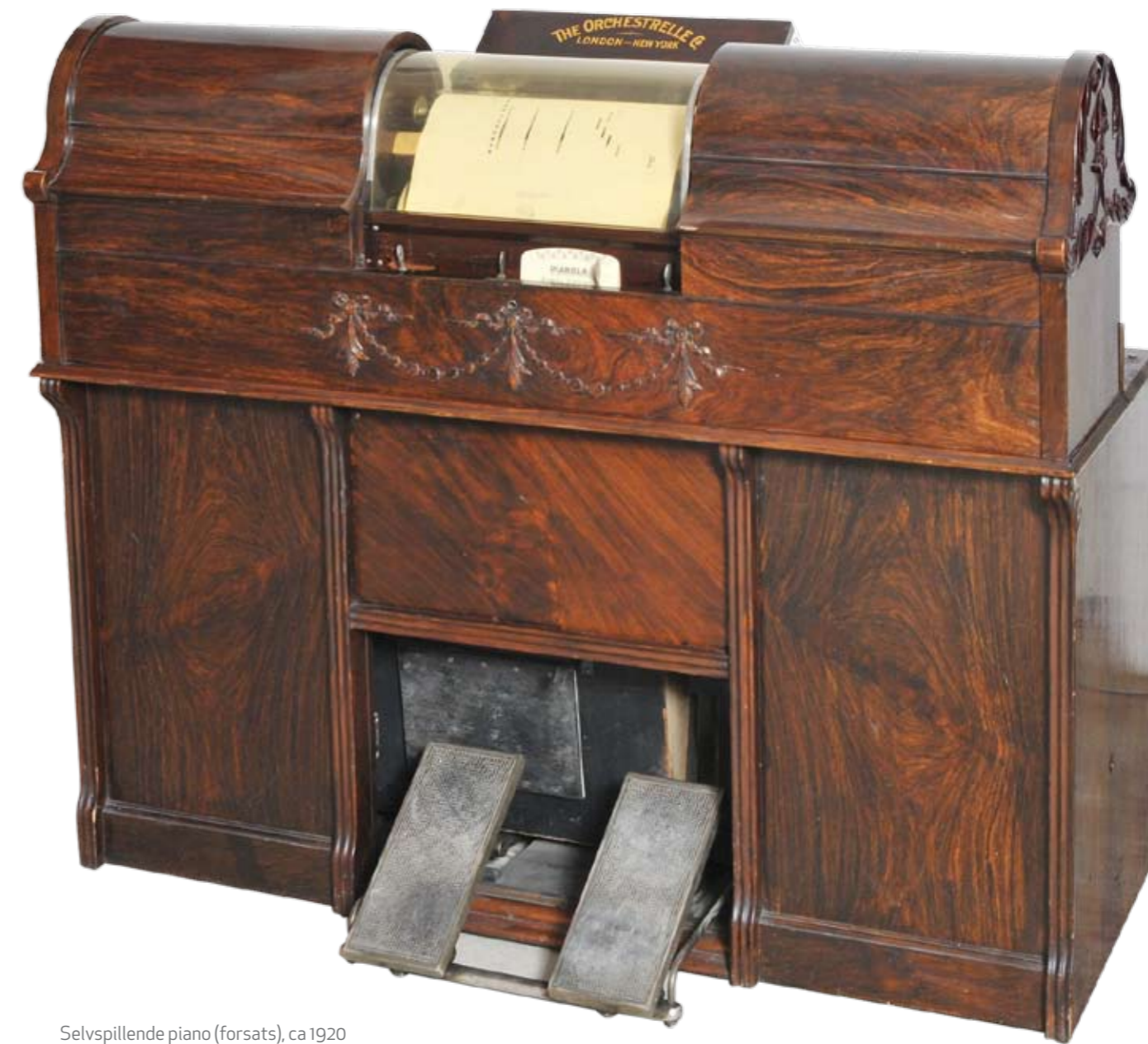
Selvspillende piano (forsats), ca 1920