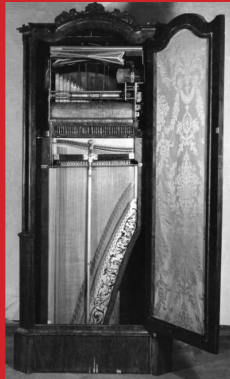
Chordaulodion, trolig 1840-tallet

En av familien Kaufmanns musikkautomater endte opp i Norge – et såkalt chordaulodion med fløyteverk, klaver og flere stiftvalser med forskjellige musikkstykker. Det to meter høye instrumentet ble bygget en gang rundt 1840 og er Norges eldste og trolig mest unike musikkautomat. I dag finnes det kun et fåtall slike instrumenter i verden.