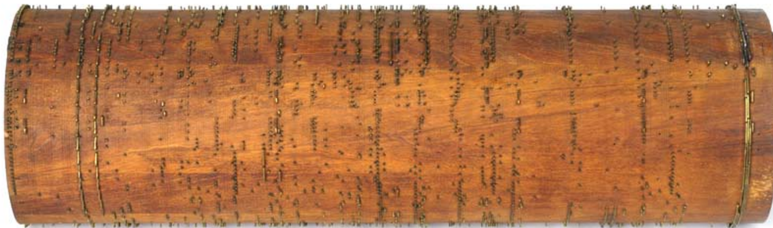
Musikkroll til chordaulodion, trolig 1840-tallet