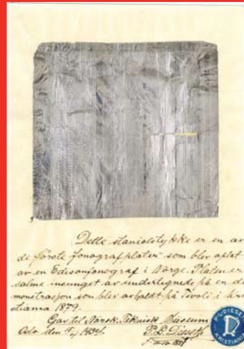
Fonografopptak fra 1879