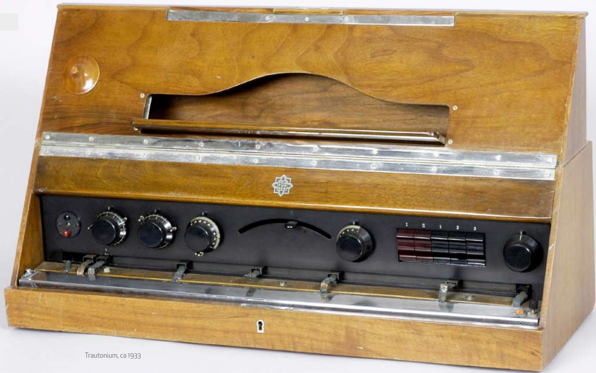
Trautonium, ca 1933